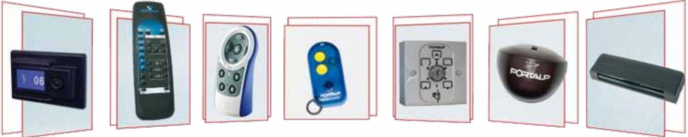
NAVIBLU | Telemando M | Telemando S | Llave IR | Selector a llaves 6 posiciones | Detección Hiperfrecuencia | Seguridad infrarrojo activo

Las puertas automáticas cortafuego alían el respeto de las reglas de construcción contra los incendios y el esteticismo de una puerta con cristal que permite el paso de la luz. Sin implicar trabajos de grueso labora, estas puertas son destinados a los lugares públicos, edificios administrativos que necesitan una protección fiable contra los incendios.