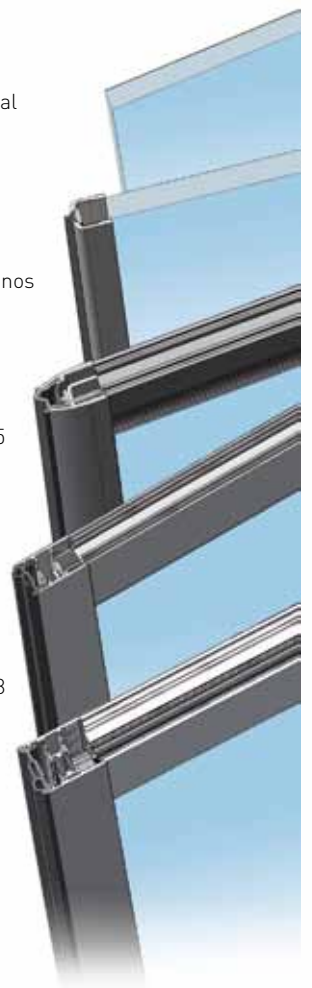
Perfiles 50 RPT